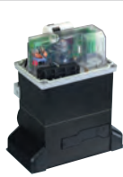
Scheda elettronica 780 D