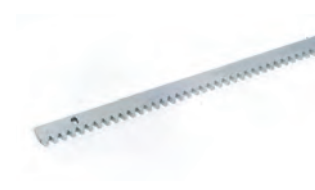
Cremagliera e catena