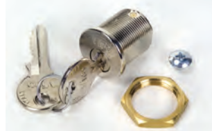
Serratura di sblocco con chiave personalizzata dal n. 1 al n. 36