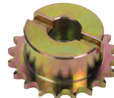
Pignone Z20 catena