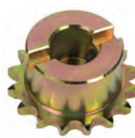
Pignone Z16 catena