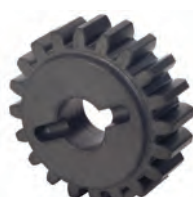
Pignone Z20 cremagliera