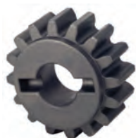
Pignone Z16 cremagliera