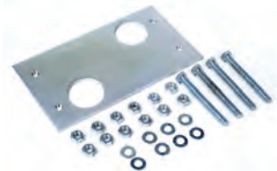
Piastra di fondazione con regolazioni laterali ed in altezza (confez. da 6 pz.)