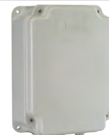
Contenitore mod. E per schede elettroniche