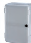
Contenitore mod. LM per schede elettroniche