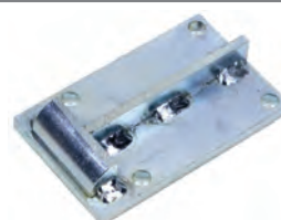
Controbocchetta per elettroserratura per scorrevoli