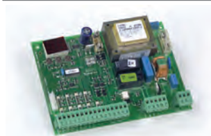
Scheda elettronica 578 D (*) (installazione remota)