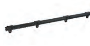
Cremagliera in nylon rinforzata 30x20 con anima di acciaio e accessori di installazione (confez. da 4 m) peso max cancello 400 kg