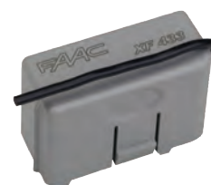
Ricevente XF433 Mhz Ricevente XF868 Mhz