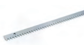
Cremagliera zincata 30x8 mod. 4 con attacchi a saldare inclusi (confez. da 4 m)