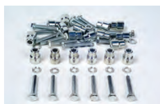
Confezione attacchi con fissaggio meccanico 18 pz.