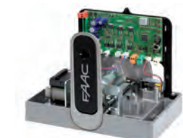
Scheda elettronica E 720 integrata