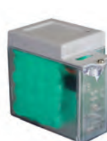
Kit batteria d'emergenza XBAT 24 (non compatibile con E 124)