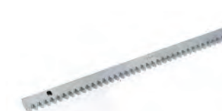
Cremagliera zincata 30x12 mod. 4 con attacchi a saldare inclusi (confez. da 4 m)