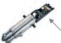
Scheda elettronica E550 incorporata Caratt. tecniche a pag. 156