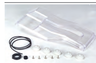
Kit per grado di protezione IP 44