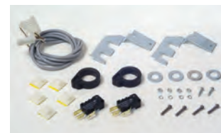
Kit installazione fincorsa apertura e chiusura