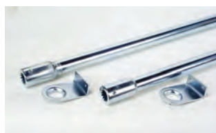
Coppia tubi di trasmissione con supporti laterali, per installazione con 1 o 2 operatori