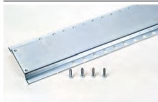
Longherone di fissaggio lunghezza 1,5 m