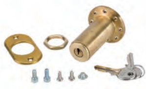
Sblocco esterno a chiave per porte con spessore max 15 mm (dal n. 1 al n. 36)