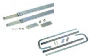
Confezioni con due bracci telescopici dritti o curvi