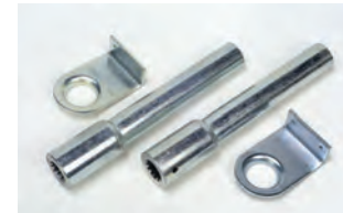
Coppia tubi di trasmissione con supporti laterali, per installazione con 1 o 2 operatori