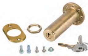
Sblocco esterno a chiave per porte con spessore oltre 15 mm (dal n. 1 al n. 36)