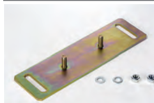
Piastra di fissaggio per regolazione tridimensionale