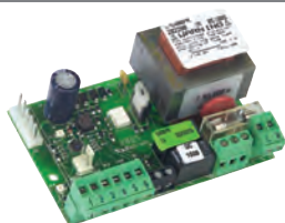
Scheda elettronica 540 BPR incorporata