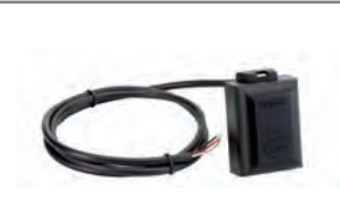
Kit ril. ostacolo Gatecorder