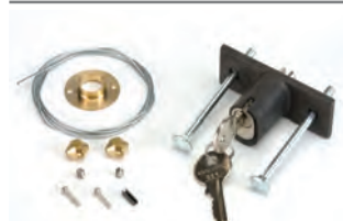
Sblocco esterno a chiave per porte con spessore oltre i 15 mm (dal n. 1 al n. 36)