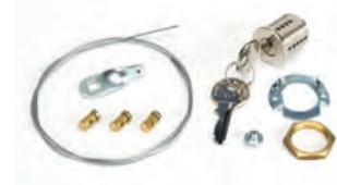
Sblocco esterno a chiave per porte con spessore max 15 mm (dal n. 1 al n. 36)