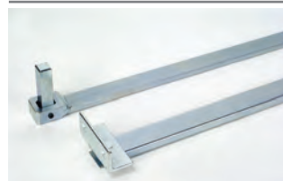
Braccio telescopico articolato con accessori per l'installazione