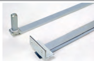
Braccio telescopico standard con accessori per l'installazione