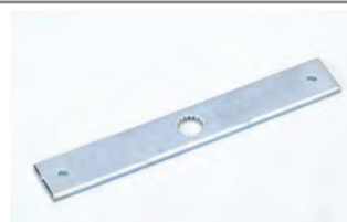
Sblocco manuale a distanza