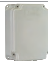
Contenitore mod. E per schede elettroniche