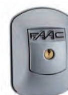
XK 21 H 230 V - Selettore a chiave antieffrazione con sblocco a leva