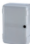
Contenitore mod. LM per schede elettroniche