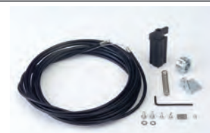
Dispositivo sblocco esterno con cavo e guaina* Lunghezza 5 m