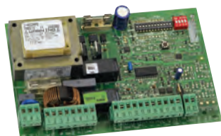
Scheda elettronica 452 MPS