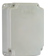
Contenitore mod. E per schede elettroniche