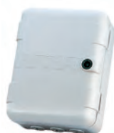
Contenitore mod. L per schede elettroniche