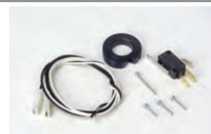
Kit Finecorsa singolo (apertura o chiusura)**