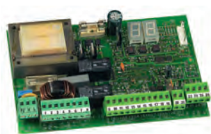
Scheda elettronica 455 D