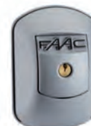
XK 21 L 24 V - Selettore a chiave antieffrazione con sblocco a leva