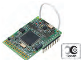
Modulo ricetrasmittente X-COM