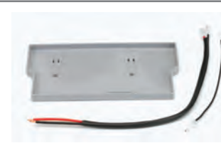
Kit supporto batteria d'emergenza (***) (specifico per E 124)