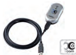
Modulo X-COM BOX