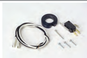
Kit Finecorsa singolo (apertura o chiusura)**