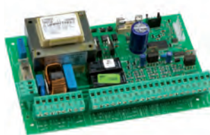
Scheda elettronica 462 DF