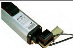
Kit rilevamento ostacolo Gatecoder (con funzione di inversione) Caratt. tecniche a pag. 161