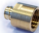
Raccordo per guaina RTA