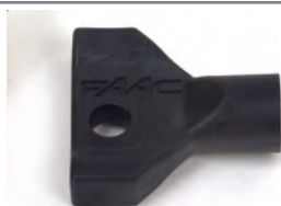
Chiave di sblocco supplementare triangolare (confez. da 10 pz.)