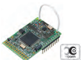
Modulo ricetrasmittente X-COM