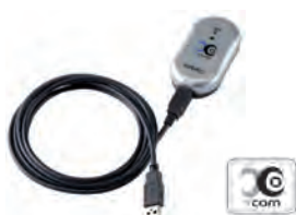
Modulo X-COM BOX