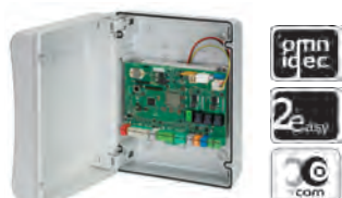
Apparecchiatura elettronica E 124