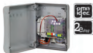
Apparecchiatura elettronica E 024S (**)