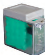
Kit batteria d'emergenza XBAT 24 (non compatibile con E 124)