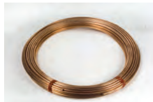
Tubo in rame Ø 6x8 mm (bobine da 20 kg - 1 kg corrisponde a circa 5 m)