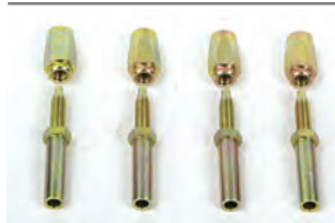
Raccordi completi (confez. da 4 e conf. da 40)