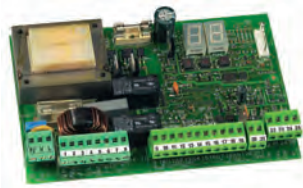
Scheda elettronica 455 D