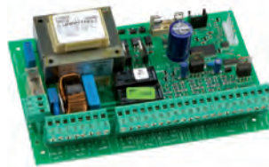
Scheda elettronica 462 DF