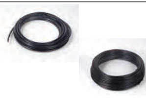
Tubo flessibili composta da 10 m. e bobina da 100 m - Ø 4x8 mm