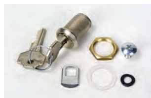
Serratura di sblocco con chiave