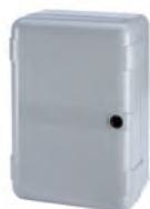
Contenitore mod. LM per schede elettroniche